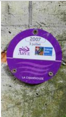
Crue 2007 de la Chandouze