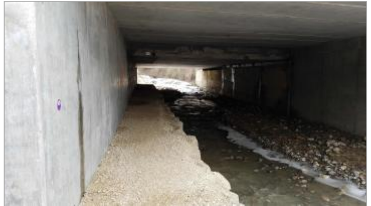
Dessous du pont RD 1206