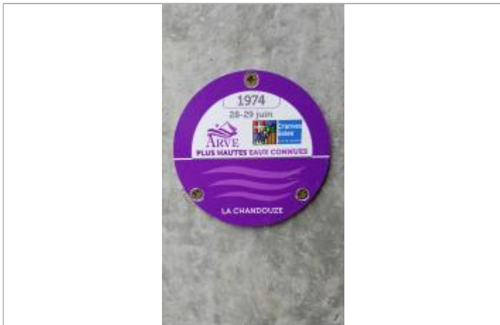
Crue de la Chandouze le 28-29 juin 1974