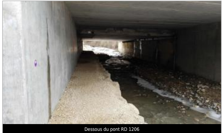
Dessous du pont RD 1206