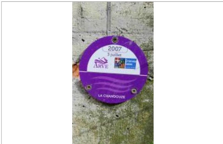
Crue 2007 de la Chandouze