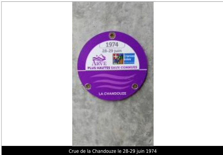
Crue de la Chandouze le 28-29 juin 1974