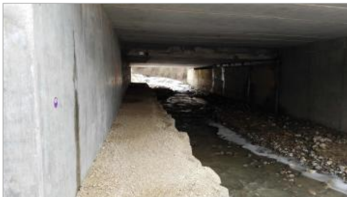
Dessous du pont RD 1206