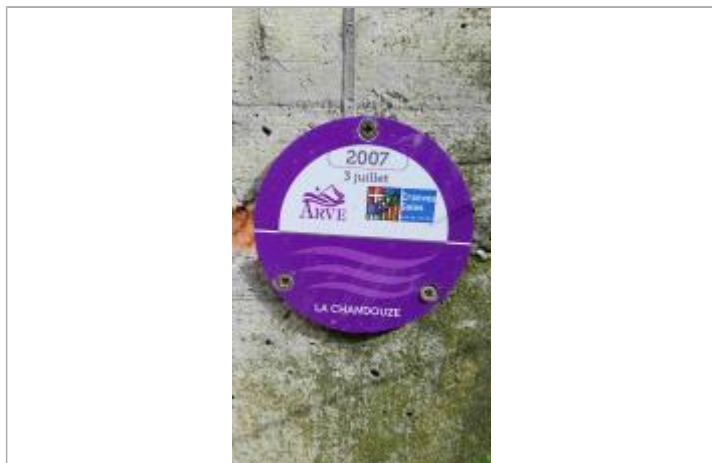
Crue 2007 de la Chandouze