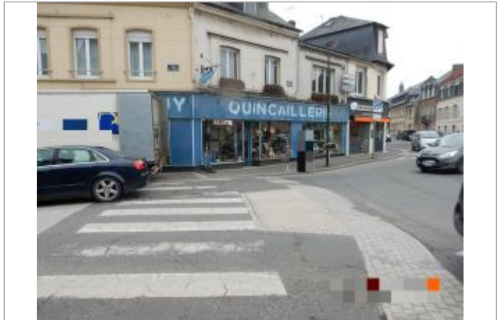
Quincaillerie, 1 place Sainte Mélaine