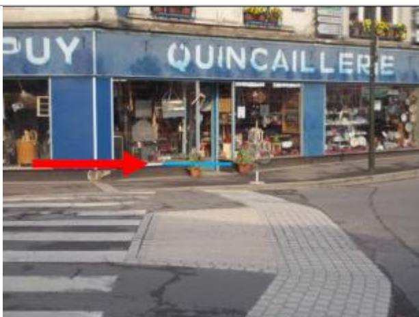
Niveau d'eau 20 cm au-dessus du seuil de la porte d'entrée.