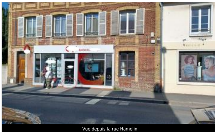
Vue depuis la rue Hamelin