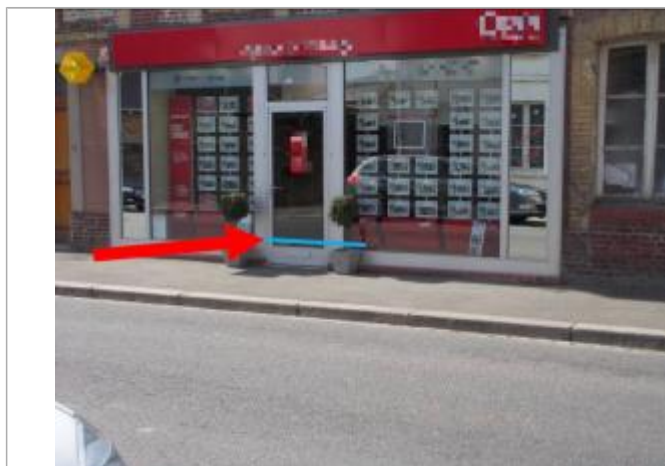
15 cm à partir du seuil de l'entrée

Altitude calculée de l'eau (en m) : 11.07