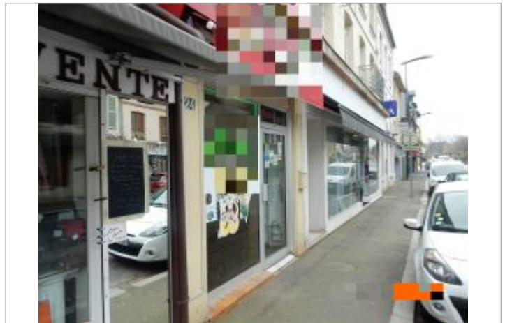
Lieu de restauration rapide au 24 rue Hamelin