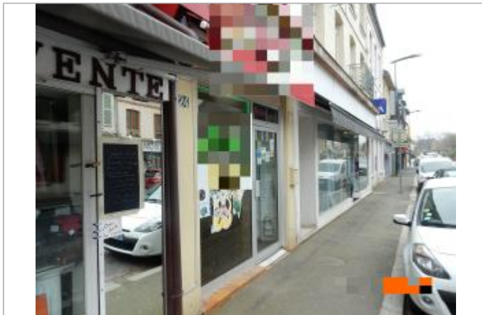
Lieu de restauration rapide au 24 rue Hamelin