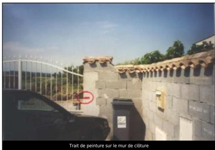
Trait de peinture sur le mur de clôture