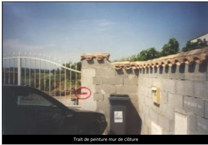
Trait de peinture mur de clôture