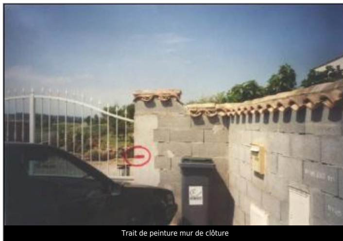
Trait de peinture mur de clôture