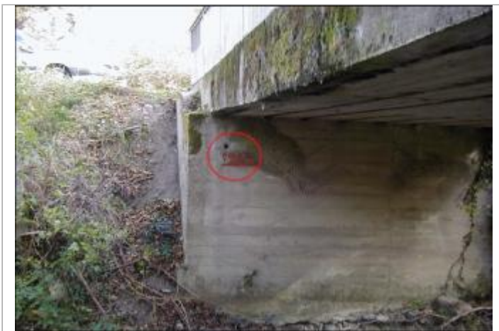
culée gauche intérieure - amont