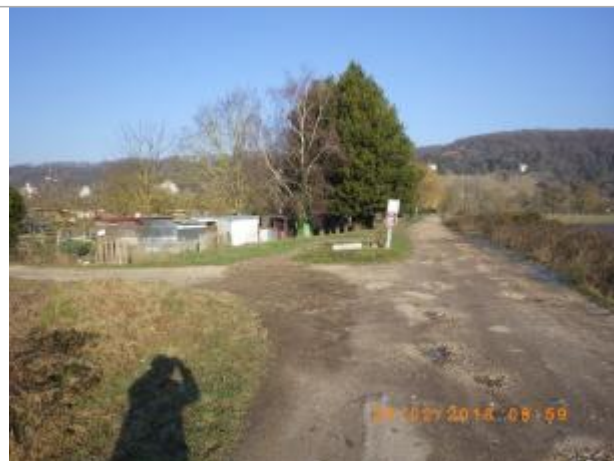
Vue vers les jardins