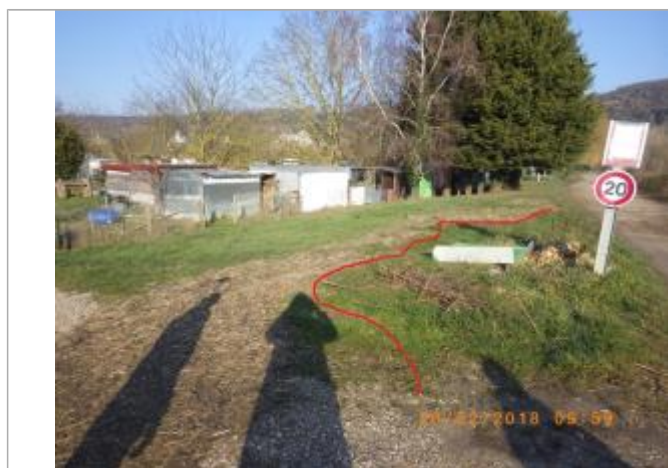
Laisse d'inondation représentée en rouge

Méthode : GPS Référence nivelée : Marque d'inondation Système altimétrique : NGF IGN 1969 (système normal) Altitude de la référence (en m) : 6.120 m Différence entre le niveau d'eau et la référence (en m) : 0.000 m Altitude calculée de l'eau (en m) : 6.12 m