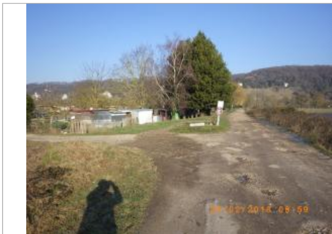
Vue vers les jardins

Coordonnées WGS84 : X: 1.04392560 / Y: 49.32078900