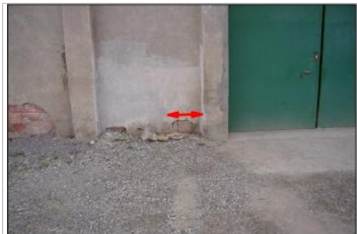
Mur de façade

GÉOLOCALISATION Coordonnées WGS84 : X: 2.51221740 / Y: 43.21919200 Coordonnées RGF93 (Lambert 93) X: 660341 / Y: 6235676.35 Coordonnées RGF93 (ETRS89) : X: 2.5122174 / Y: 43.219192