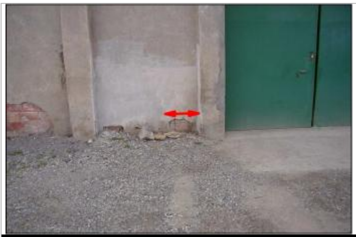
Mur de façade

GÉOLOCALISATION Coordonnées WGS84 : X: 2.51221740 / Y: 43.21919200 Coordonnées RGF93 (Lambert 93) X: 660341 / Y: 6235676.35 Coordonnées RGF93 (ETRS89) : X: 2.5122174 / Y: 43.219192