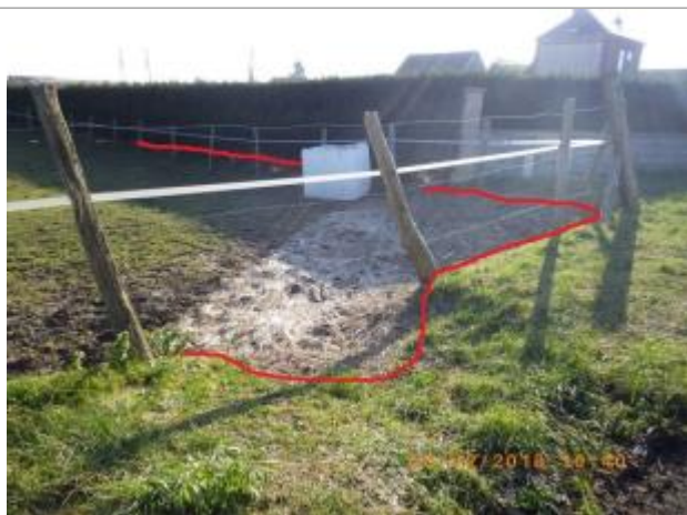
Niveau atteint lors de la crue de février 2018 repéré en rouge

NIVELLEMENT EFFECTUÉ PAR LE SPC SACN. LE SPC N'EST PAS GÉOMÈTRE EXPERT, LES COTES SONT DONNÉES À TITRE INDICATIF. - 23/02/2018