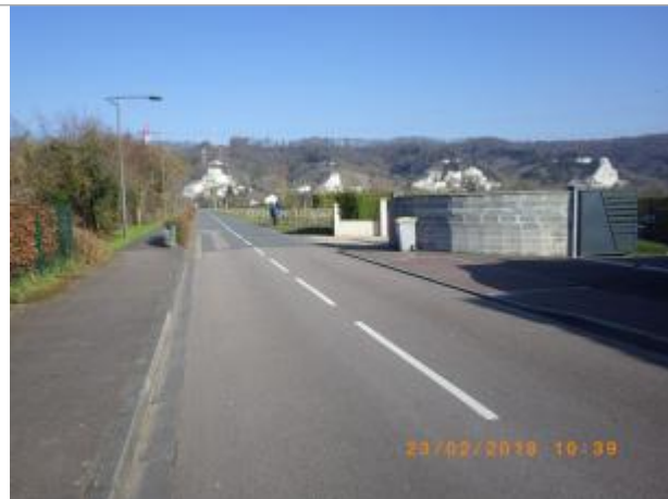
A proximité du 346 rue René Sortemboc