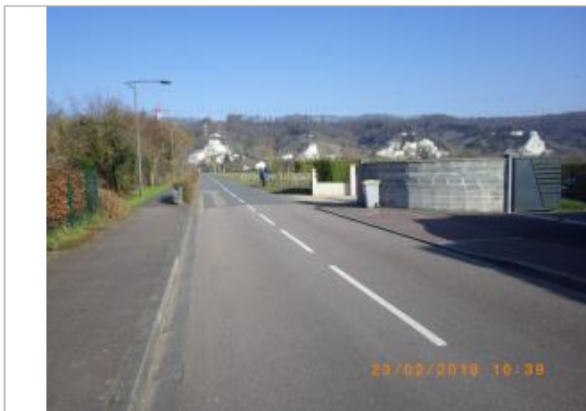
A proximité du 346 rue René Sortemboc

Coordonnées WGS84 : X: 1.03134290 / Y: 49.31881600