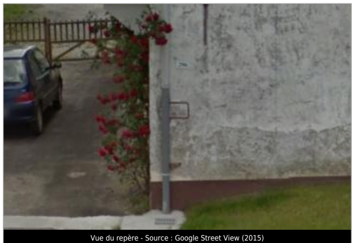
Vue du repère - Source : Google Street View (2015)

MARQUE Maximum de l'inondation : Oui Visibilité : Oui État du repère : Moyen Pérennité : Longue