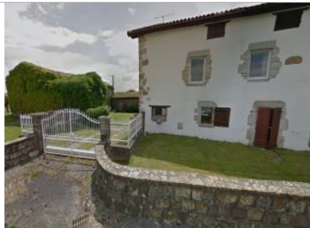
Vue du site - source : Google Street View (2015)

Unité de gestion : Gironde-Adour-Dordogne Code : WEB_S_202205293637 Date de mise à jour : 01/03/2018 Auteur : gestionnaire_SCVigicrues