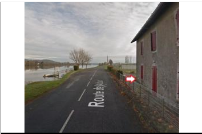
Vue du site - source : Google Street View (2016)

GÉOLOCALISATION Coordonnées WGS84 : X: -1.23391390 / Y: 43.52104870 Coordonnées RGF93 (Lambert 93) X: 357724.05 / Y: 6278286.4 Coordonnées RGF93 (ETRS89) : X: -1.2339139 / Y: 43.5210487 Code Hydro: Q--0000 Rive de référence: Gauche