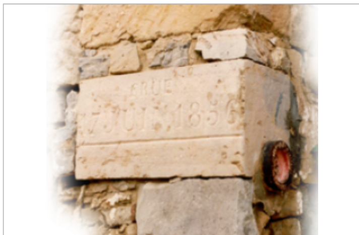
Vue des repères