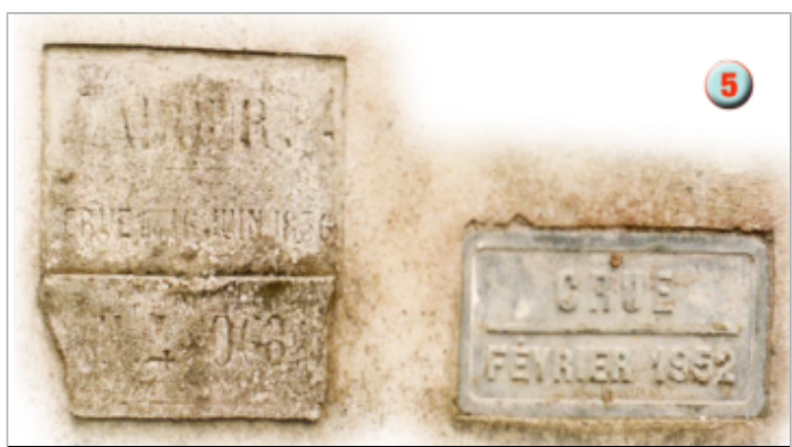
Vue des repères

MARQUE Texte : CRUE FEVRIER 1952 Maximum de l'inondation : Oui Visibilité : Oui État du repère : Moyen Pérennité : Longue