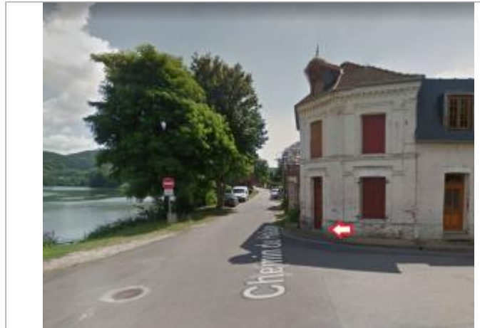
Vue du site

Coordonnées WGS84 : X: 1.24392190 / Y: 49.30584700