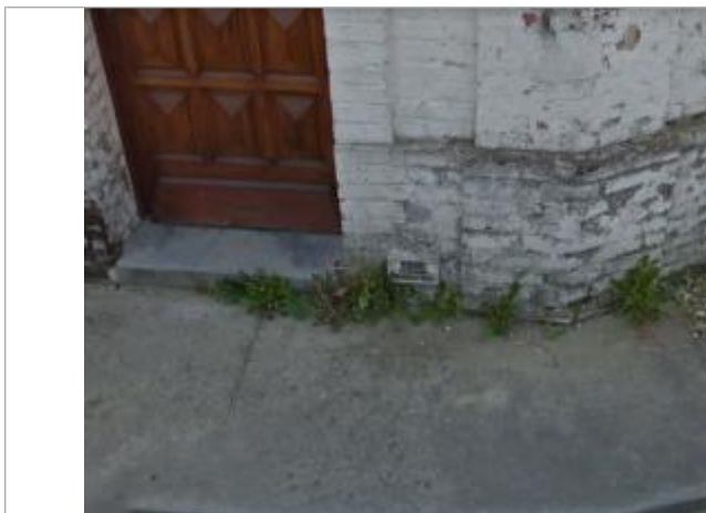
Vue du repère

NIVELLEMENT DU SPC/SACN. LE SPC N'EST PAS GÉPOMÈTRE EXPERT, LES COTES SONT DONNÉES À TITRE INDICATIF. - 28/02/2023