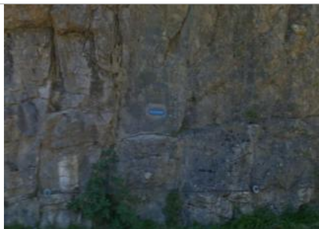
Vue du repère supposé - Source : Google Street View (2014) / à confirmer