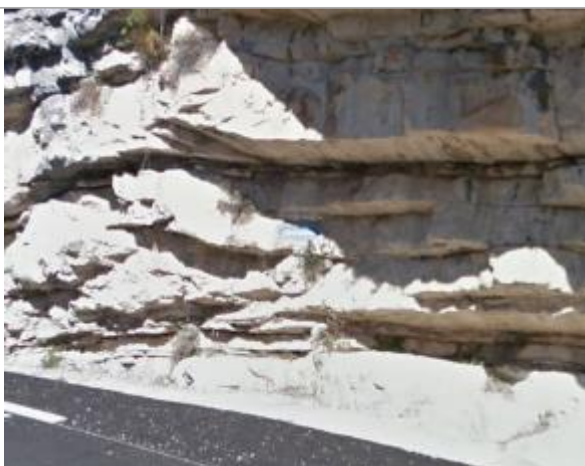
Vue du repère supposé