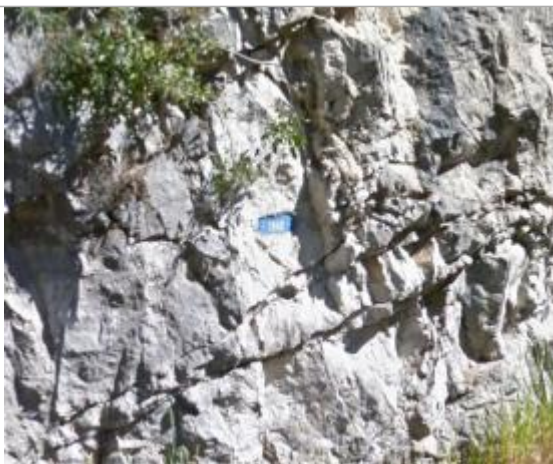
Vue du repère - Source : Google Street View (2014)