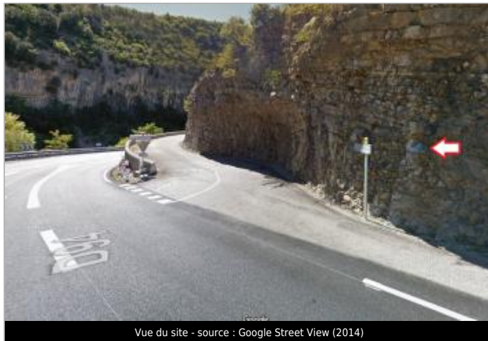
Vue du site - source : Google Street View (2014)