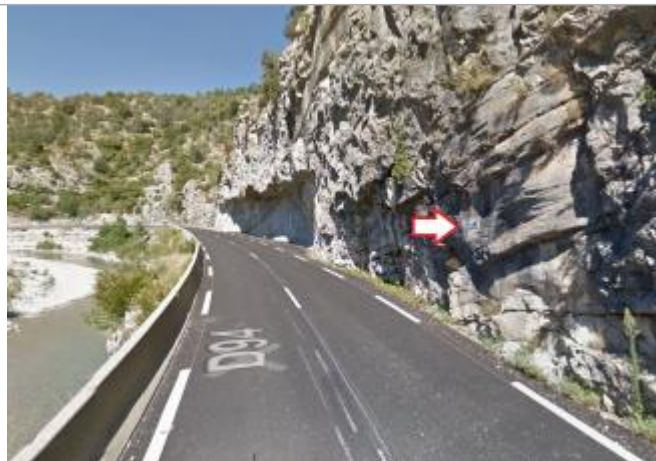
Vue du site - source : Google Street View (2014)