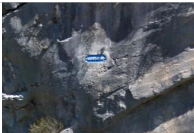
Vue du repère supposé - Source : Google Street View (2014) / à confirmer