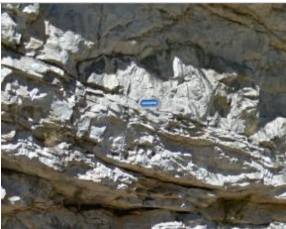
Vue du repère supposé / à confirmer