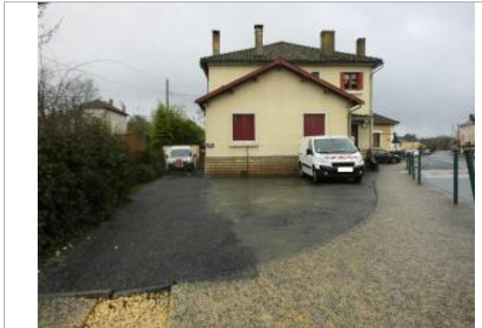
Vue de la maison