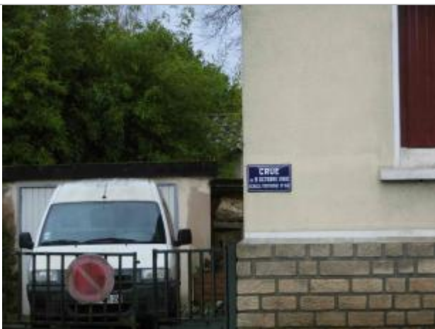
Position du repère