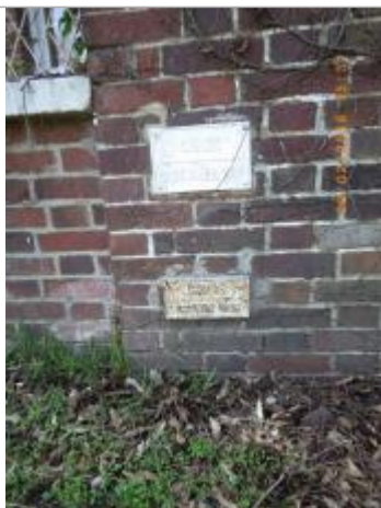
Repères des crues de 1910 et 1945

Altitude calculée de l'eau (en m) : 9.86 m