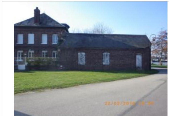
1 place de la République

Coordonnées WGS84 : X: 1.23803390 / Y: 49.30830600