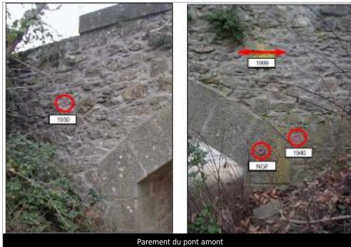
Parement du pont amont

Coordonnées WGS84 : X: 2.50696320 / Y: 43.21874310