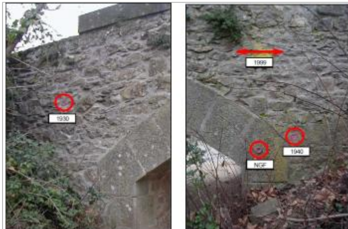
Parement du pont amont

Coordonnées RGF93 (ETRS89) : X: 2.5069632 / Y: 43.2187431