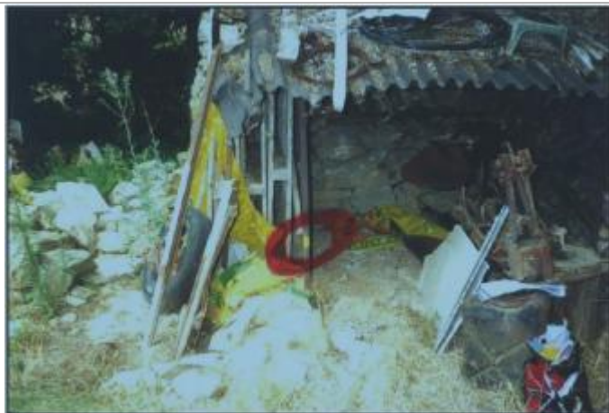
Cabane de jardin

Altitude calculée de l'eau (en m) : 80.34 m