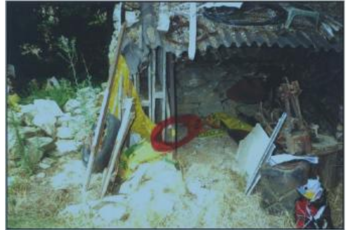
Cabane de jardin