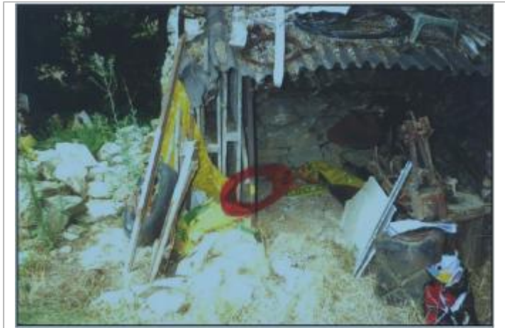
Cabane de jardin