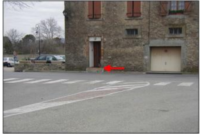
Haut de seuil de la marche