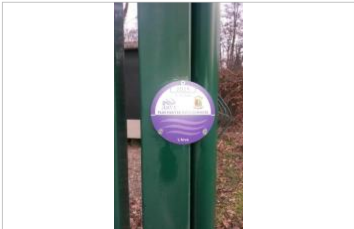
Crue de l'Arve le 1-4 mai 2015