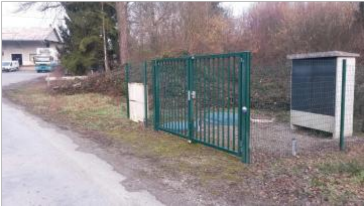
Transformateur électrique, Route de l'étang