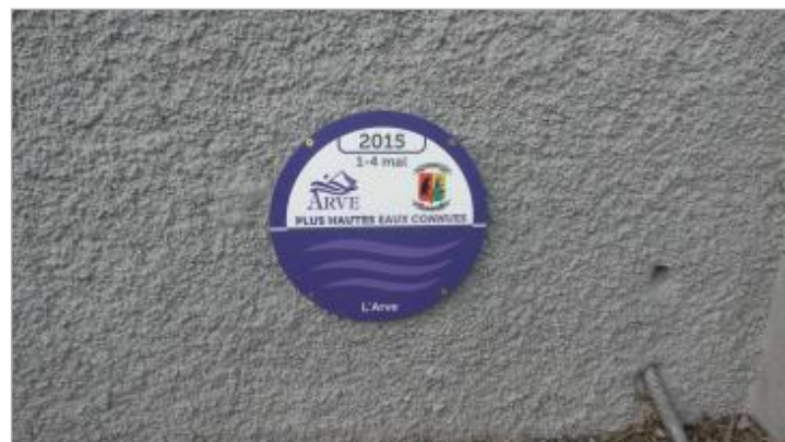
Crue de l'Arve à Arthaz-Pont-Notre-Dame le 1-4 mai 2015