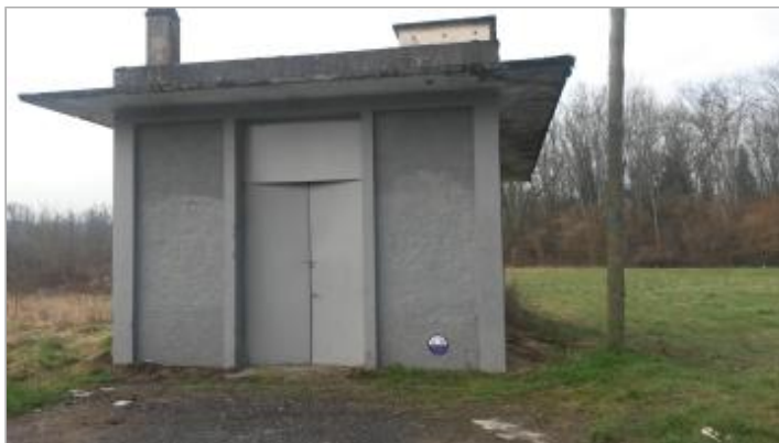
Ancienne station de pompage (route de Nant)