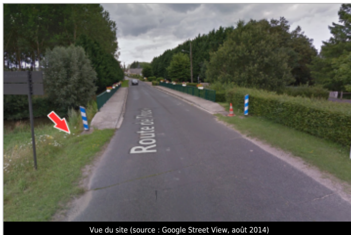
Vue du site