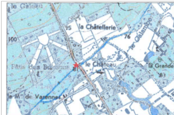
Carte recensement d'origine