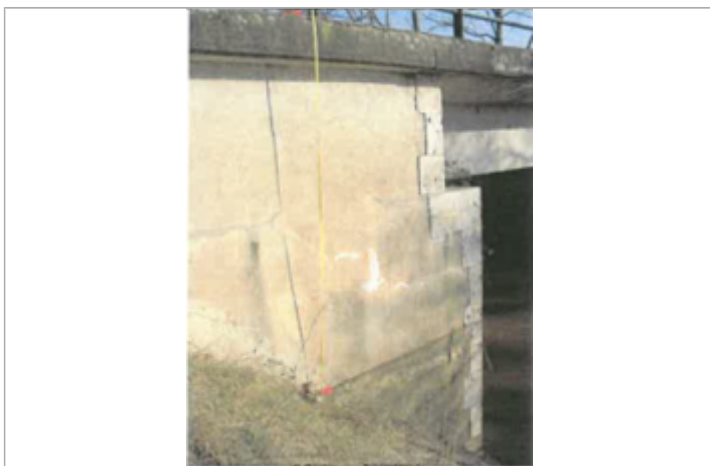
Photo recensement d'origine

Altitude calculée de l'eau (en m) : 79 m