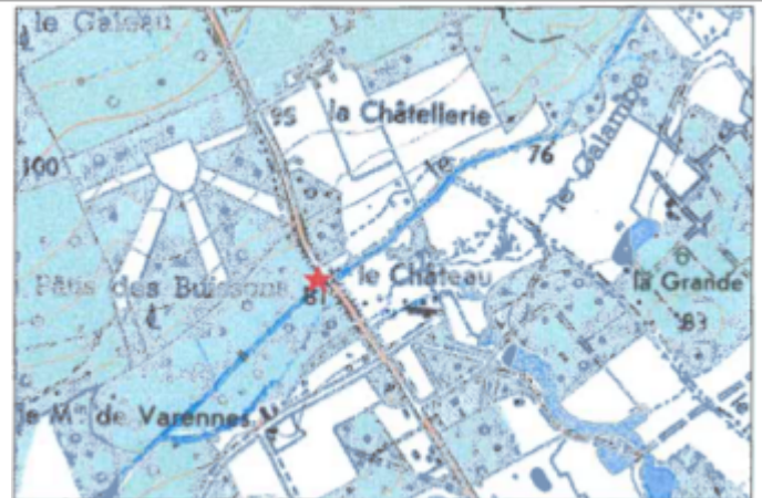
Carte recensement d'origine