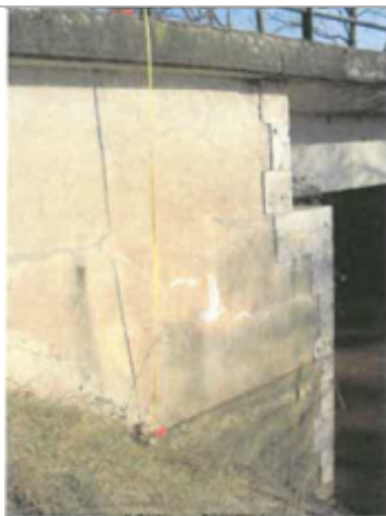
Photo recensement d'origine

Altitude calculée de l'eau (en m) : 79 m