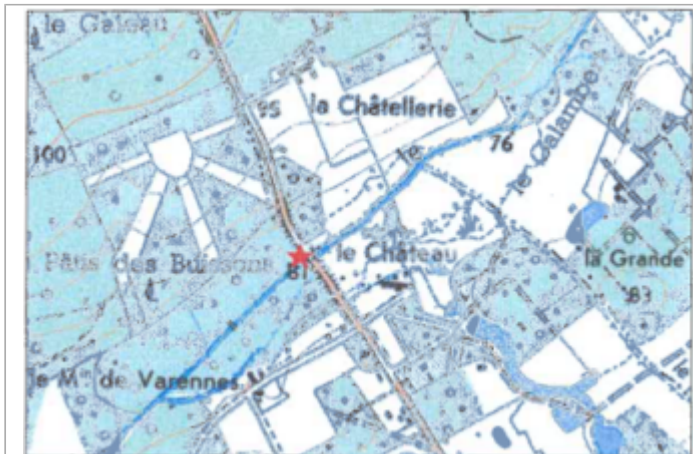
Carte recensement d'origine