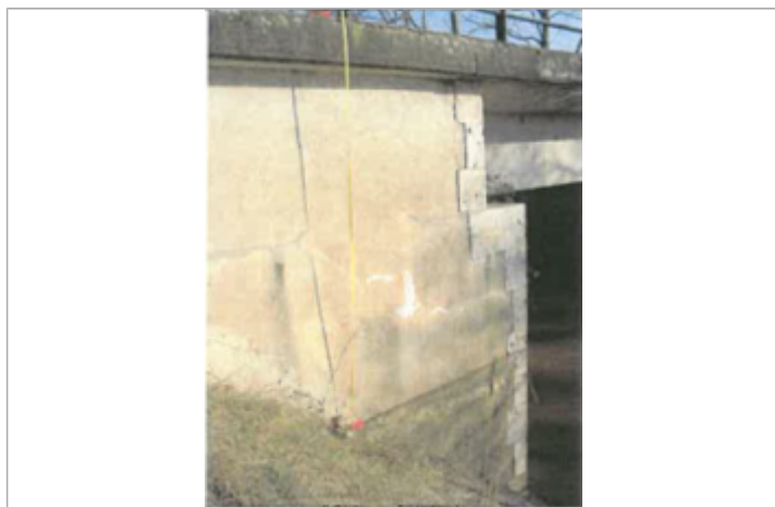
Photo recensement d'origine