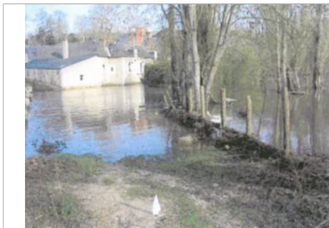
Site pendant la crue (photo recensement d'origine)

Visibilité : Oui État du repère : Non renseigné Pérennité : Non renseigné