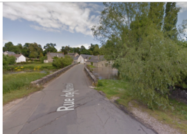
Vue du site

Coordonnées WGS84 : X: 1.40948650 / Y: 47.57892860 Coordonnées RGF93 (Lambert 93) X: 580445.88 / Y: 6721043.23 Coordonnées RGF93 (ETRS89) : X: 1.4094865 / Y: 47.5789286 Code Hydro: K47-0300 Rive de référence: Gauche