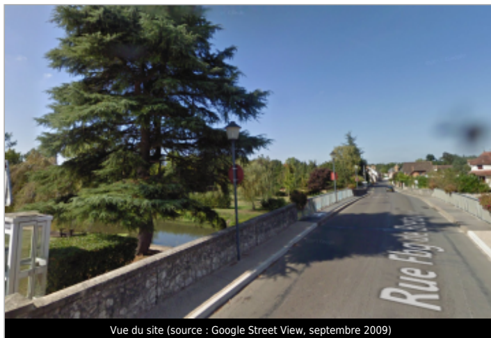
Vue du site