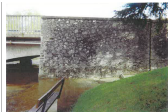
Site et repère pendant la crue (photo recensement d'origine)