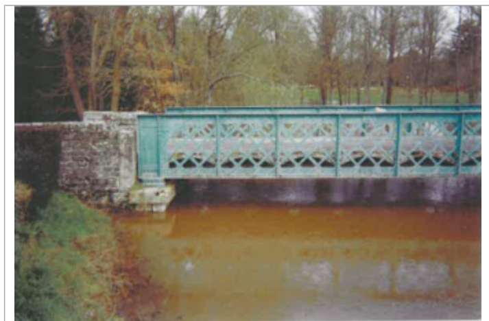
Site pendant la crue (photo recensement d'origine)

Méthode : Inconnue Organisme : CETE Normandie - Centre Référence nivelée : Non renseigné Système altimétrique : NGF IGN 1969 (système normal) Altitude de la référence (en m) : 80.350 m Altitude calculée de l'eau (en m) : 80.35