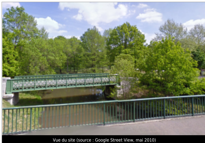
Vue du site