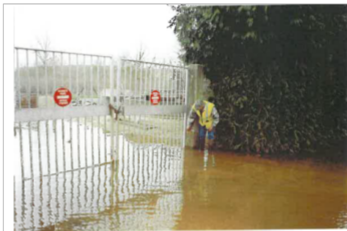
Site pendant la crue (photo recensement d'origine)

Altitude calculée de l'eau (en m) : 80.25