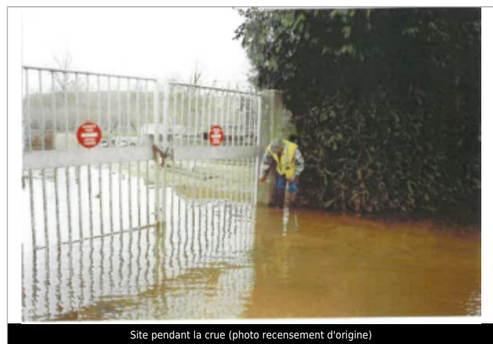
Site pendant la crue (photo recensement d'origine)