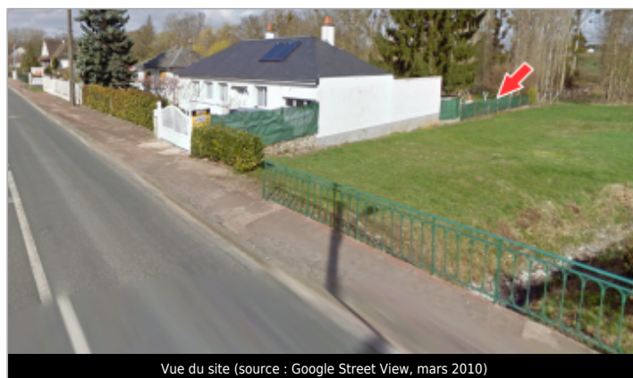
Vue du site