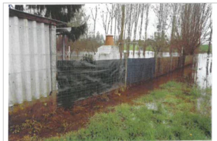
Site pendant la crue (photo recensement d'origine)