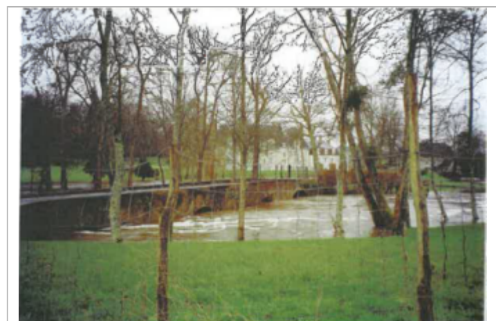
Site pendant la crue (photo recensement d'origine)

SOURCE DE REPÉRAGE : AZI DU COSSON EN LOIR-ET-CHE - 01/02/2006 Type de repérage : Source bibliographique Organisme(s) : CETE Normandie - Centre, DDE 41