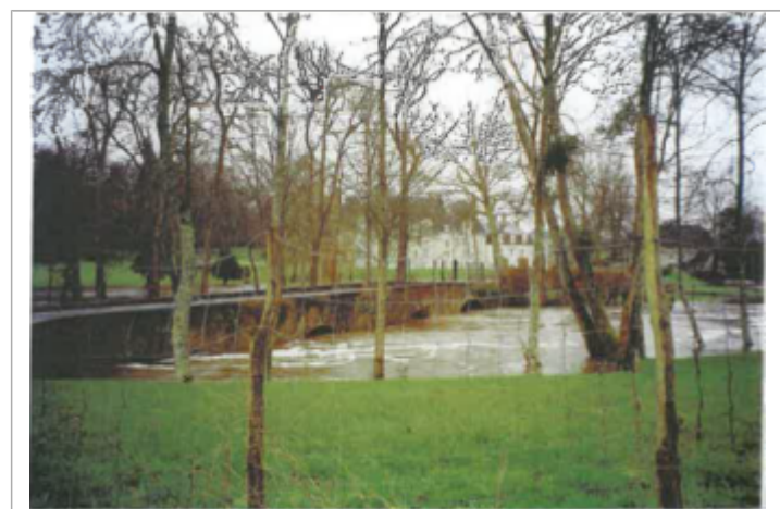
Site pendant la crue (photo recensement d'origine)

SOURCE DE REPÉRAGE : AZI DU COSSON EN LOIR-ET-CHER - 01/02/2006 Type de repérage : Source bibliographique Organisme(s) : CETE Normandie - Centre, DDE 41