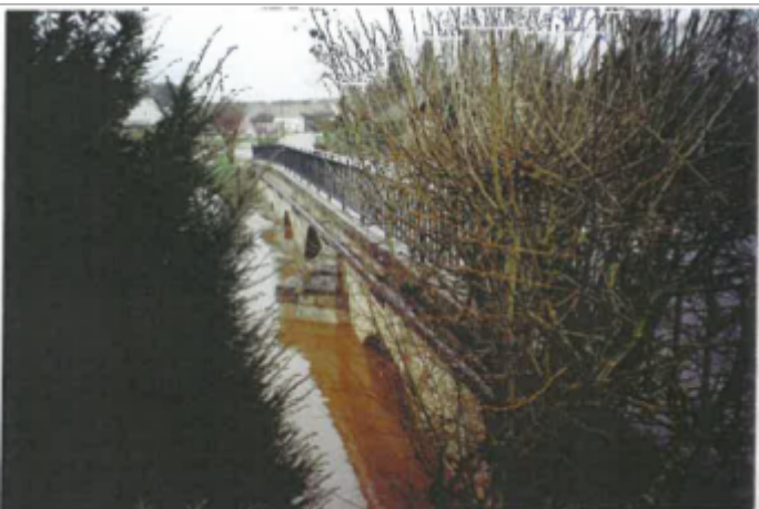
Site pendant la crue (photo recensement d'origine)

Altitude calculée de l'eau (en m) : 69.6