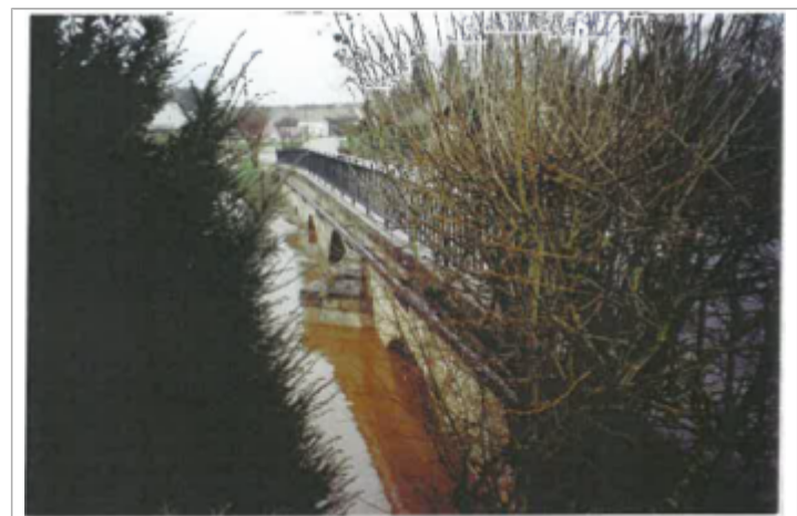
Site pendant la crue (photo recensement d'origine)

MARQUE Maximum de l'inondation : Oui Visibilité : Non renseigné