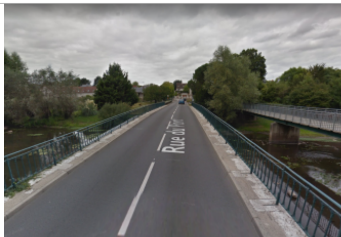
Vue du site