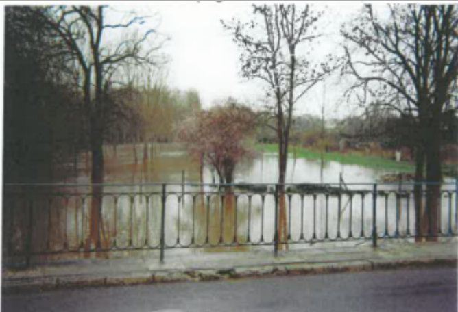
Site et repère pendant la crue (photo recensement d'origine)

Altitude calculée de l'eau (en m) : 69.7 m