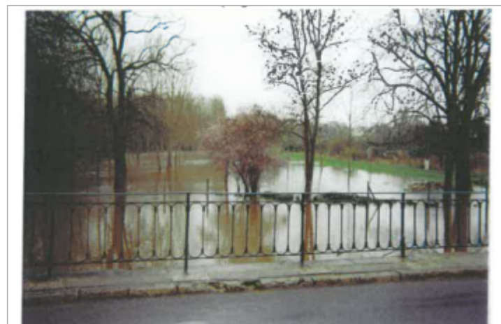
Site et repère pendant la crue (photo recensement d'origine)

MARQUE Maximum de l'inondation : Oui Visibilité : Oui État du repère : Disparu Pérennité : Aucune