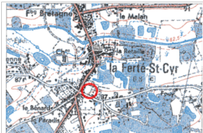
Carte recensement d'origine (positionnement approximatif)