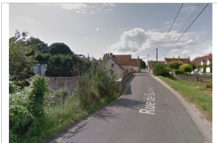
Vue du site