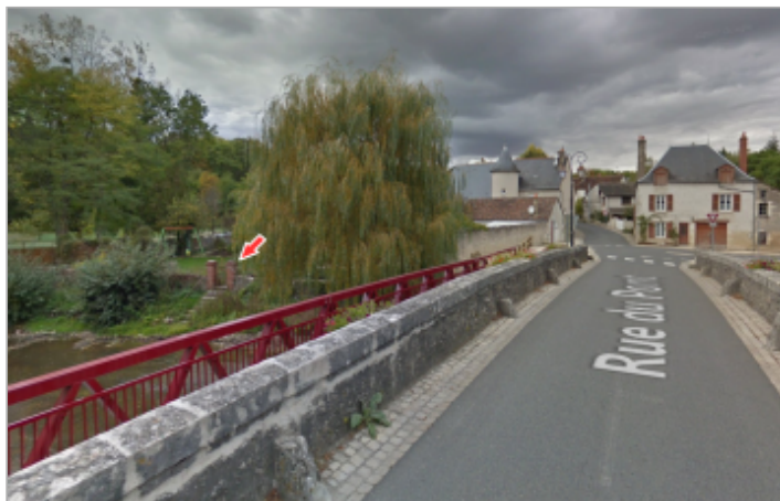
Vue du site depuis le pont de la D72