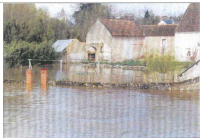
Site et repère pendant la crue (photo recensement d'origine)

SOURCE DE REPÉRAGE : AZI DU COSSON EN LOIR-ET-CHER - 01/02/2006